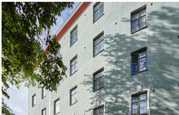
Franzeninkatu 5, Helsinki