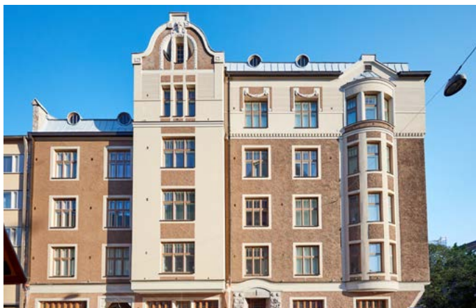
Punavuorenkatu 1, Helsinki

Suunnittelemme ikkunat yksilöllisesti rakenteiden, vaatimusten ja toiveiden mukaisesti. Hoidamme asennukset ja työnjohdon aina kohteen vaatimusten ja suunnitelmien mukaisesti.