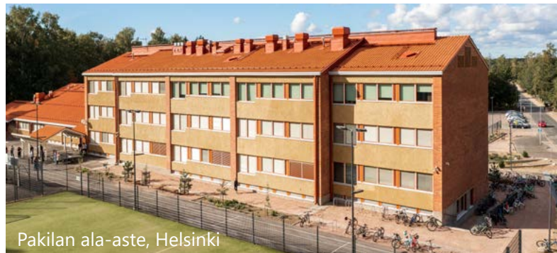
Pakilan ala-aste, Helsinki

Aleksis Kiven koulu, Porvoonkatu 2, Helsinki Kallion ala-aste, Neljäs Linja 11-15, Helsinki Käpylän peruskoulu Väinölä, Väinöläntie 7, Helsinki Pakilan ala-aste, Halkosuontie 88, Helsinki Pihlajamäen ala-aste, Lucina Hagmanin kuja 3, Helsinki Jokipuiston koulu, Pilvilinnantie 7, Sipoo Kotkan lyseo, Arcus, Kirkkokatu 15, Kotka RUK, päärakennus, Kadettikoulunkatu 6, Hamina Tampereen Vanha TEKU, Pyynikintie 2, Tampere Hotel Energy, Pieni Roobertinkatu 3, Helsinki KOy Helsingin Näyttelijäntie 24, Helsinki Ympäristöministeriö, Aleksanterinkatu 7, Helsinki Arttelisali, Veteraaninkatu 2, Oulu Runeberginkatu 32, Porvoo Kakola, Graniittilinnankatu 2, Turku Kulmahovi, Raastuvankatu 7, Vaasa Tikkurilan Silkki A5-rakennus, Silkkitie 5, Vantaa